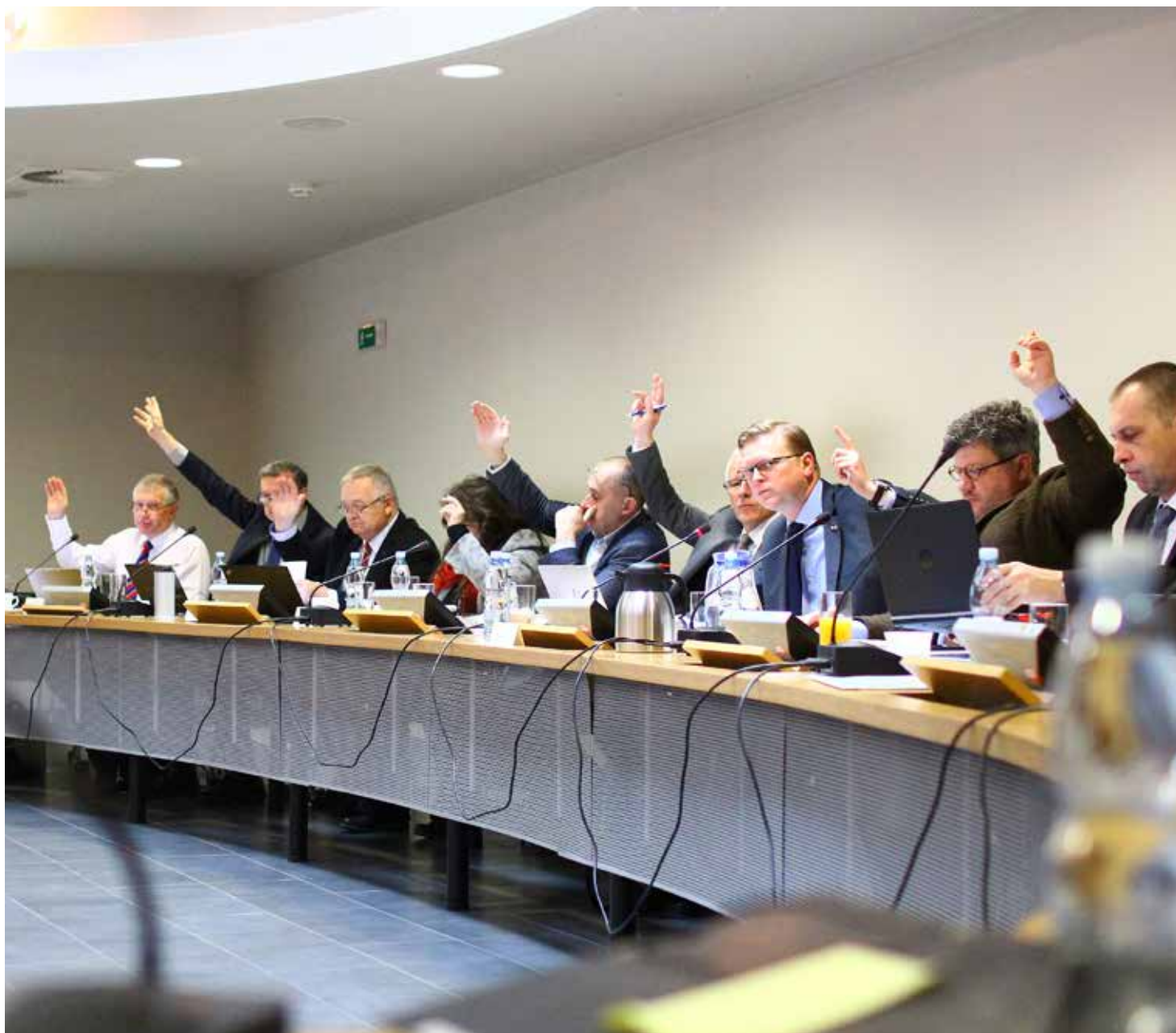
Foto: Z výjezdního zasedání RVVI na Technické univerzitě v Liberci.