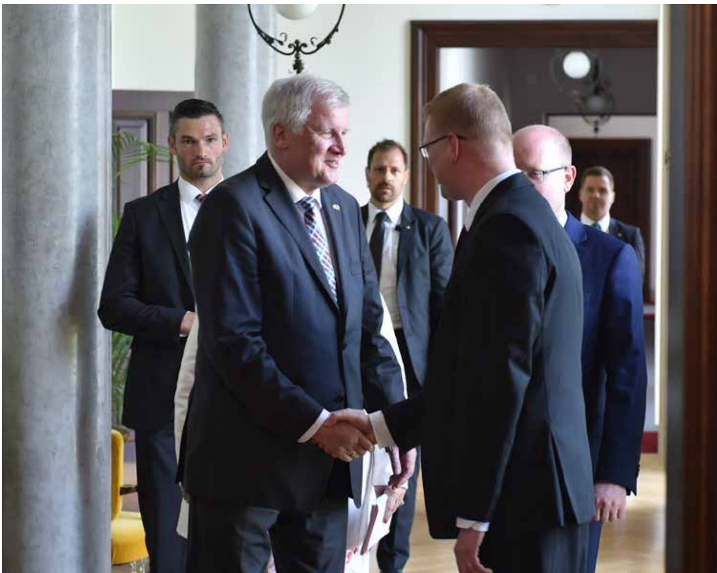
Foto: Z aktuálního setkání Horsta Seehofera s Pavlem Bělobrádkem na Úřadu vlády ČR

Během pracovní návštěvy společnosti Maxe Plancka v Mnichově v květnu 2016 došlo k propojení společnosti Maxe Plancka s Akademií věd ČR. Ve vzájemné spolupráci nyní připravují konferenci na téma transferu technologií a ochrany duševního vlastnictví. ✘